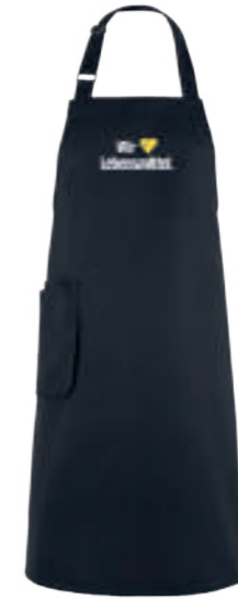
SCHWARZ WOL 88743 blanko 881071

Zum Binden, stufenlos verstellbares Nackenband, große Eingriffstasche rechts mit zusätzlicher Utensilientasche, Bindebänder, Utensilientasche, Blasebalg, Latzblende und Halsband in Schwarz.