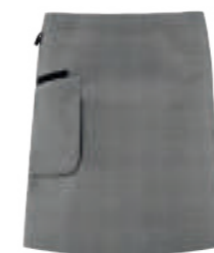
SCHWARZ GLENCHECK/ SCHWARZ 88471

Größen: onesize Gewebe: 100% PES, ca. 42 g (Stückgewicht)