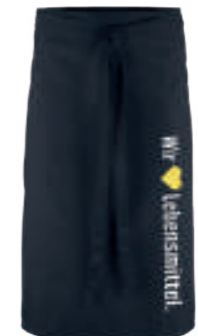
SCHWARZ WOL 89903