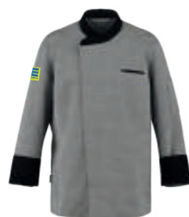
SCHWARZ GLENCHECK/ SCHWARZ E-Block 180045 blanko 18371