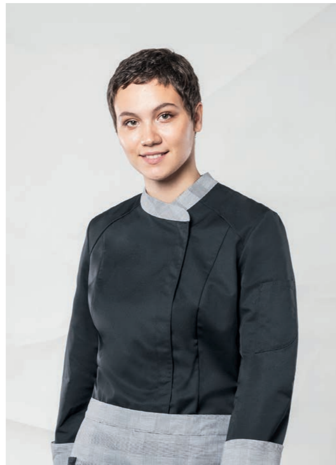
Koch-/ Servicejacke Damen 494876