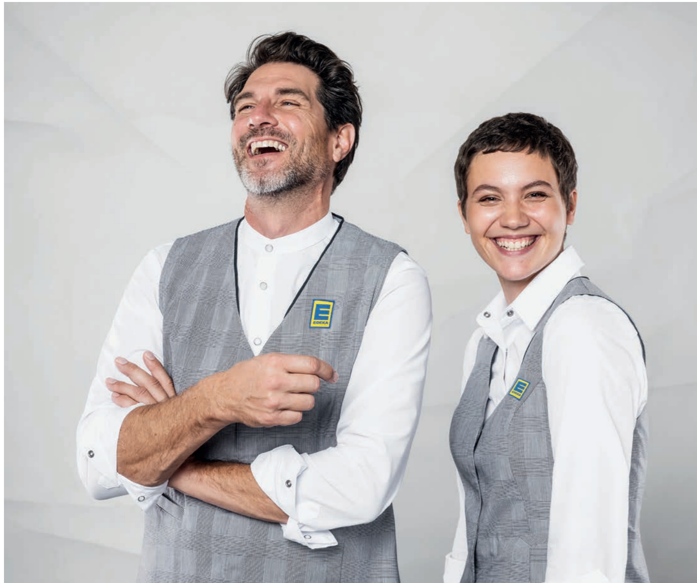
Weste Herren 15033, Hemd 910443, Weste Damen 140366, Bluse 480365