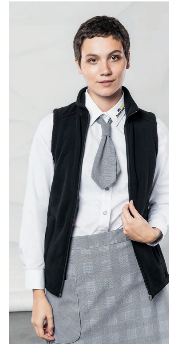
Bluse 480875, Fleeceweste 140079, Halbschürze 88471, Servicebinder 90371