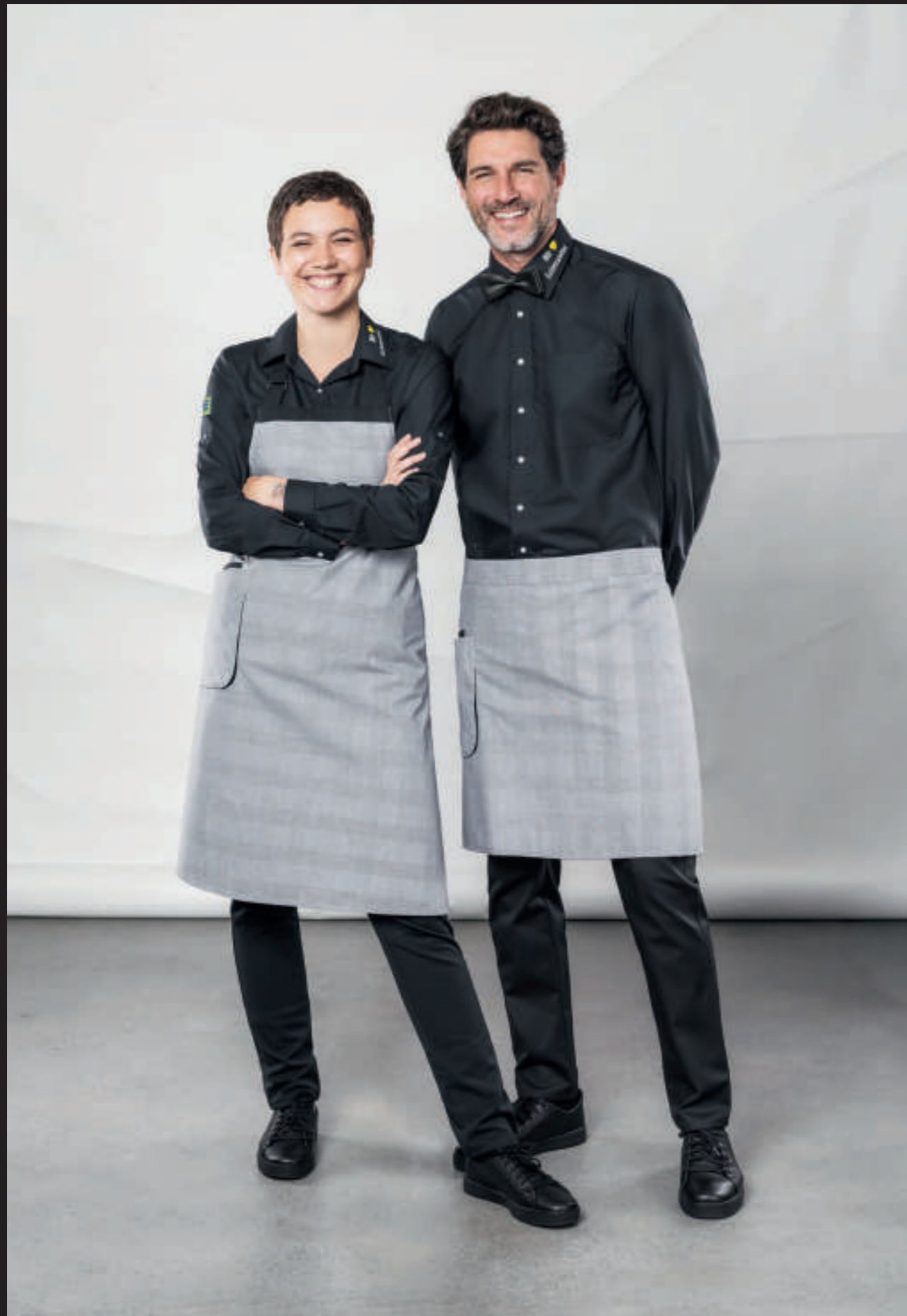
Bluse 480876, Latzschürze 89370, Hemd 910876, Fliege 90722, Halbschürze 88471