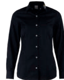
SCHWARZ WOL 480876 blanko 480366