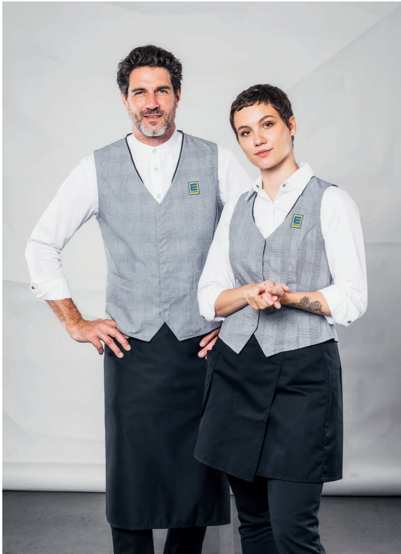
Weste Herren 15033, Bistroschürze 891743, Bluse 480365, Weste Damen 140366, Rockschrürze 88821