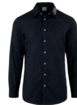
SCHWARZ WOL 910876 blanko 910166