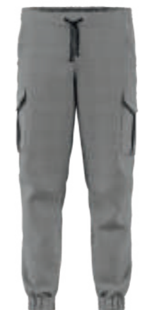
SCHWARZ GLENCHECK 20371