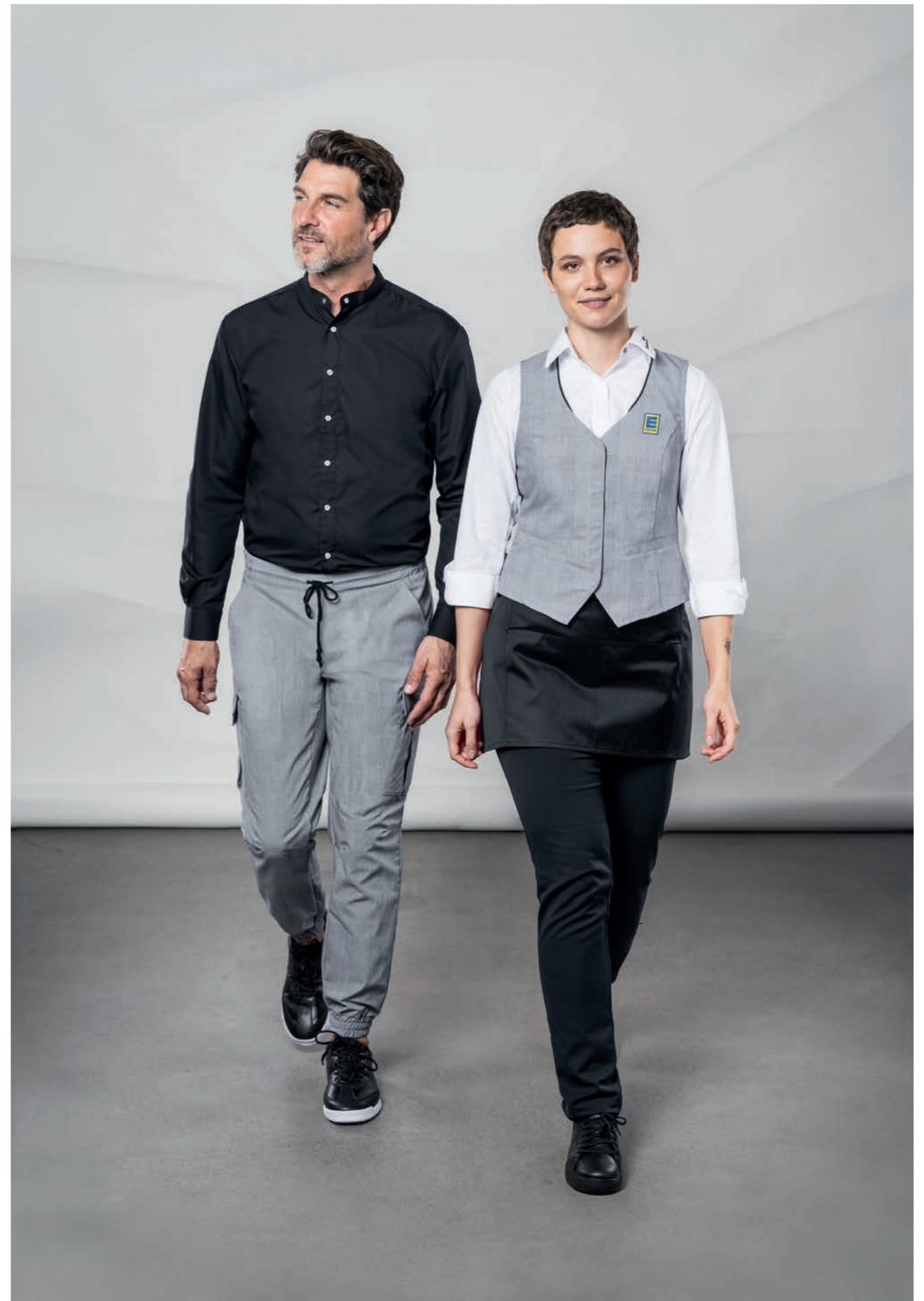
Hemd 910442, Cargohose 20371, Bluse 480875, Weste 140366, Kurzschürze 871353