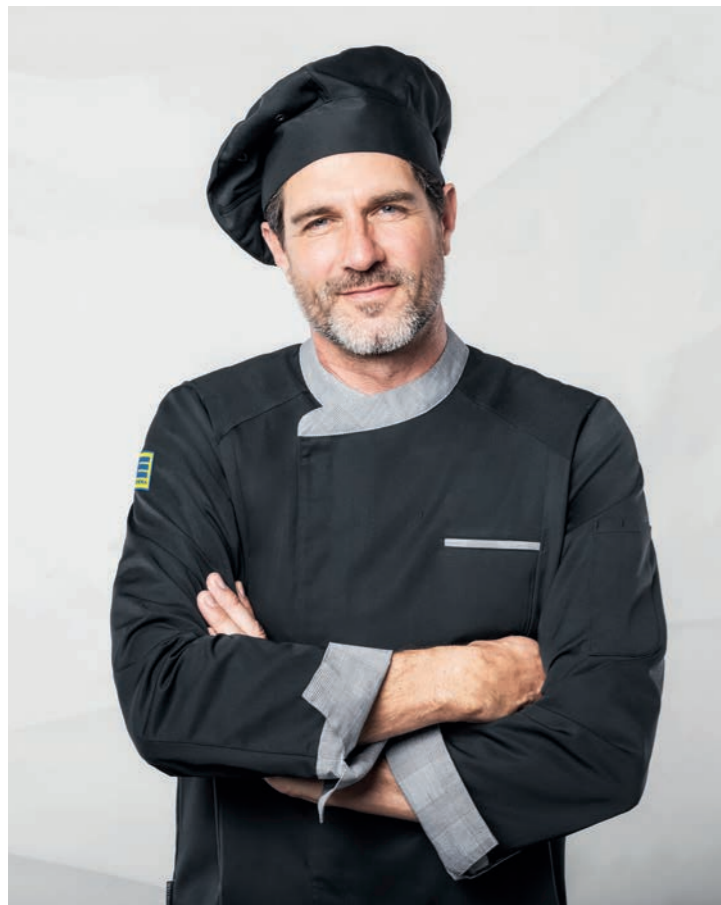
Koch-/ Servicejacke Herren 180044