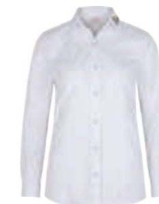
WEISS WOL 480875 blanko 480365