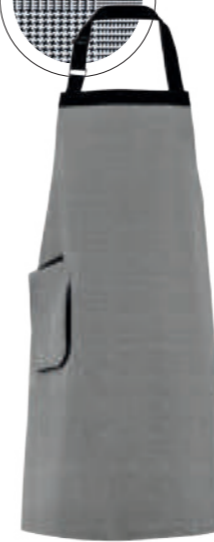
SCHWARZ GLENCHECK/ SCHWARZ 89370