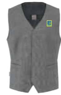
SCHWARZ GLENCHECK/ SCHWARZ E-Block 15033 blanko 15271