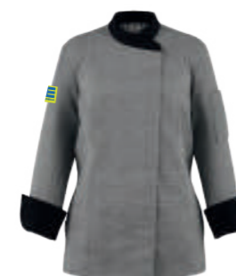
SCHWARZ GLENCHECK/ SCHWARZ E-Block 494877 blanko 49371