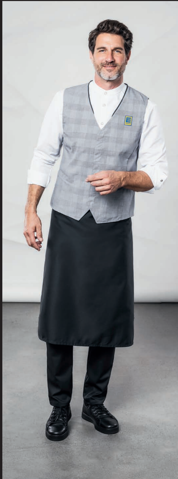
Hemd 910443, Weste 15033, Bistroschürze 891743