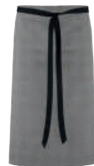
SCHWARZ GLENCHECK/ SCHWARZ 89371

Zum Binden, Multifunktions- tasche mit 4-fach Eingriff, Bindebänder und Schlüssel- schleife in Schwarz.