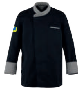
SCHWARZ/SCHWARZ GLENCHECK E-Block 180044 blanko 18370