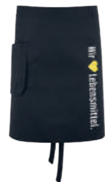
SCHWARZ WOL 88713 blanko 881101

Zum Binden, Formbund, große Eingriffstasche rechts mit zusätzlicher Utensilientasche, Bindebänder, Utensilientasche, Blasebalg und Schlüsselschleufe in Schwarz.