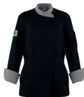
SCHWARZ/SCHWARZ GLENCHECK E-Block 494876 blanko 49370