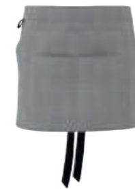
SCHWARZ GLENCHECK/ SCHWARZ 88472

Zum Binden, Multi- funktionstasche mit 4-fach Eingriff.